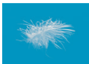
Peluria con piumette