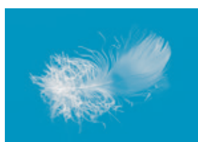
Piumette con peluria